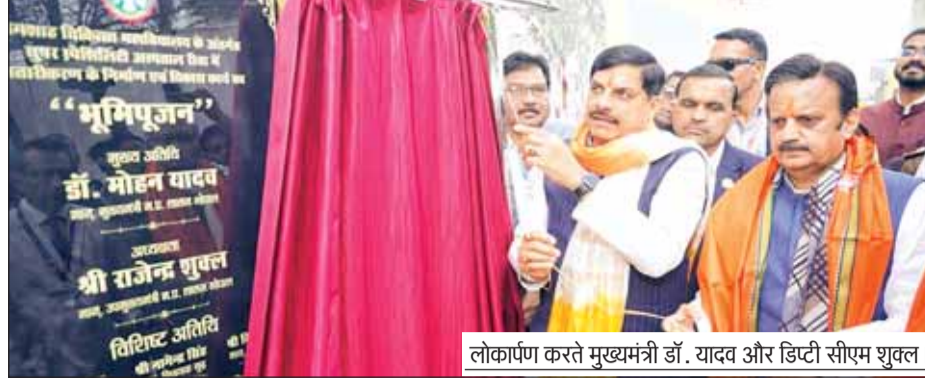
लोकार्पण करते मुख्यमंत्री डॉ. यादव और डिप्टी सीएम शुक्ल।

खास बातें ■ मध्यप्रदेश में मेडिकल एजुकेशन के अंडर ग्रेजुएशन की सीटें बढ़कर हुई 5500 ■ हर साल 10 हजार डॉक्टर मेडिकल की पढ़ाई पूरी कर देंगे सेवाएं