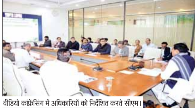
वीडियो कॉन्फ्रेंसिंग में अधिकारियों को निर्देशित करते सीएम।

कृषक कल्याण वर्ष का करें प्रभावी क्रियान्वयन, कृषि वर्ष की गतिविधियों की करें नियमित मॉनिटरिंग